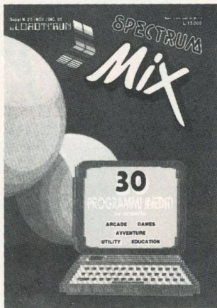
Cover: IBM courtesy